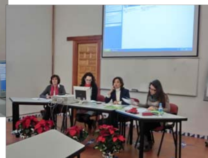
Momento de la Asamblea