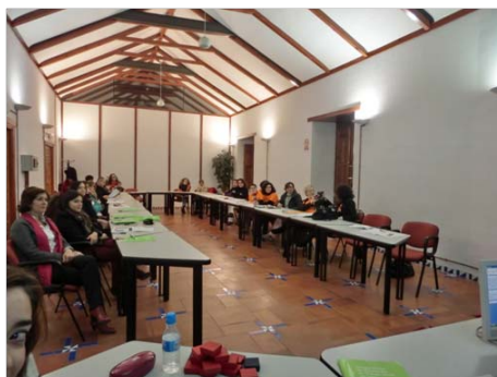
Asistentes a la Asamblea

De entre los acuerdos que se tomó en Asamblea, uno de ellos fue suscribirse de nuevo a la revista "Servicios Sociales y Política Social", pero solo se suscribirán a aquellos/as colegiados/as que estén interesados/as en recibir la publicación. Si no se llegará al 75% de colegiados/as interesados (mínimo que exige la revista para la suscripción) se suscribirá a partir del número 147 de colegiación, número que salió del sorteo realizado en Asamblea.