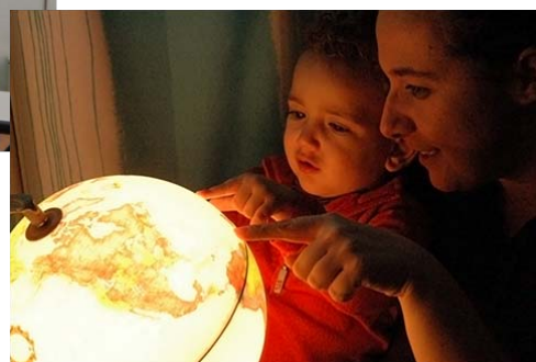
Fotografía ganadora: “Abrazo en el tiempo”